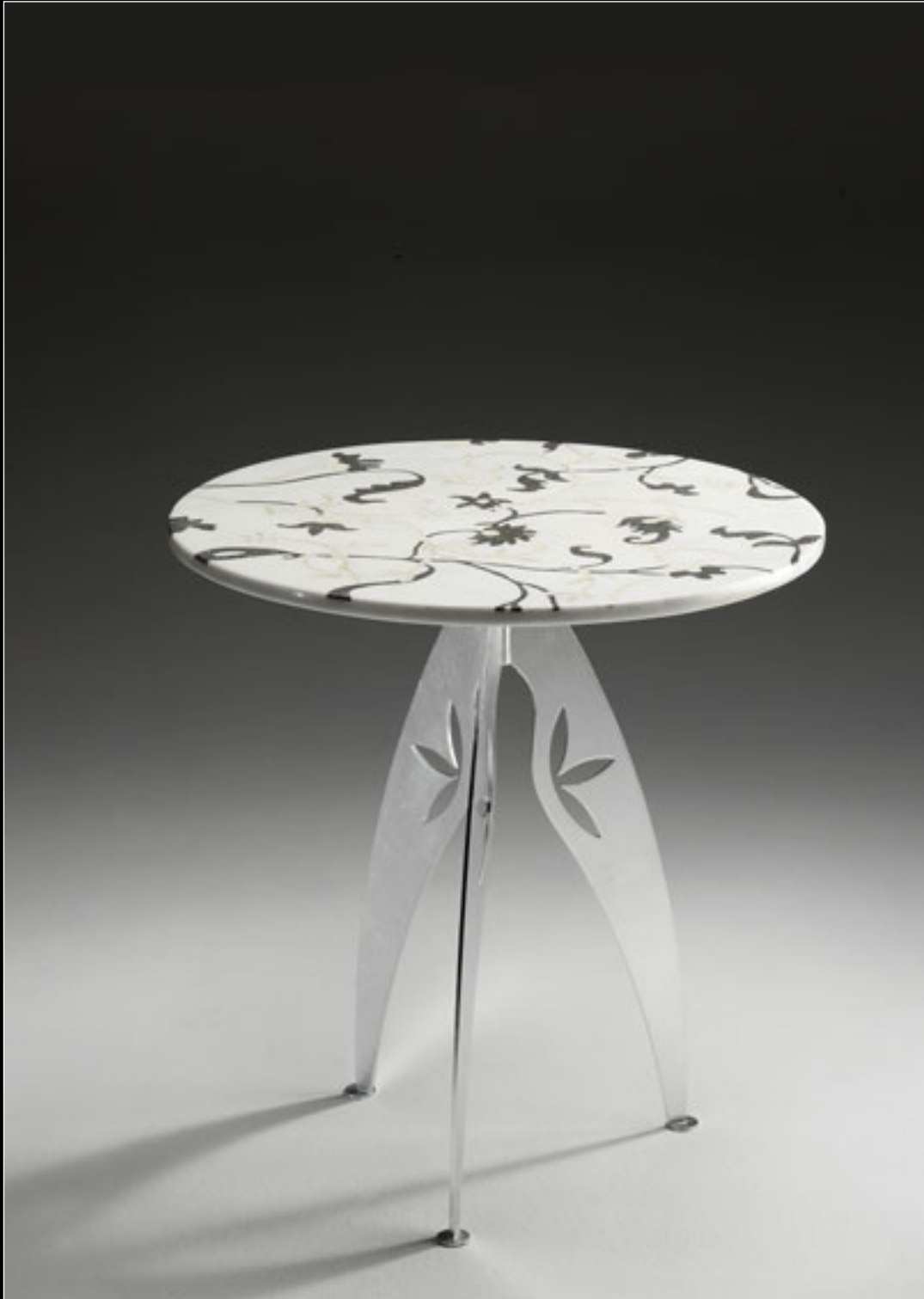
ST30N D65 H62