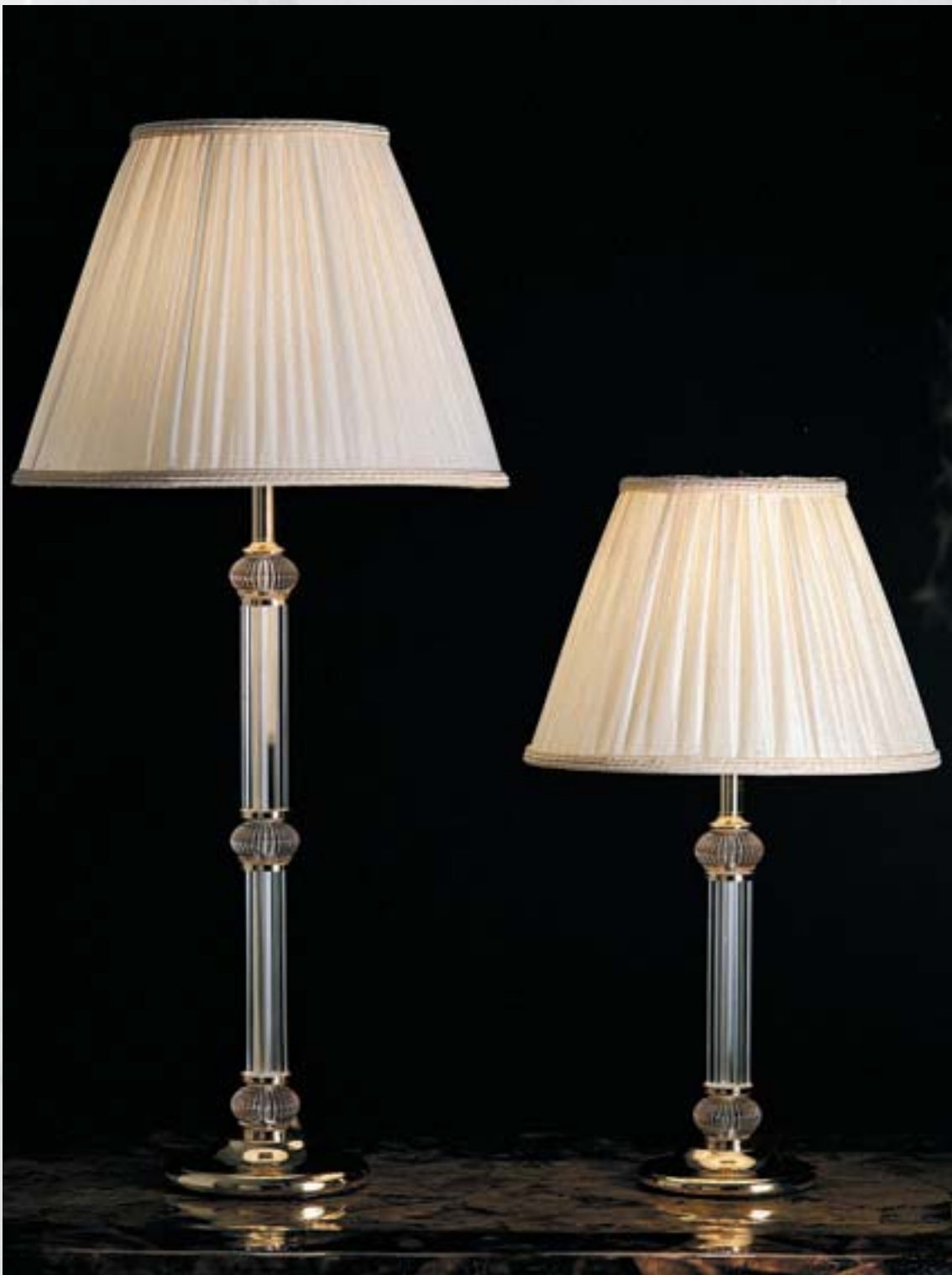
6351 - D40 H70 • 6350 - D34 H49