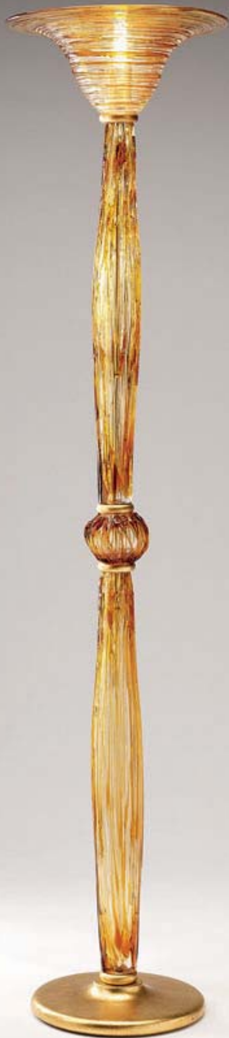
4109 - D42 H178