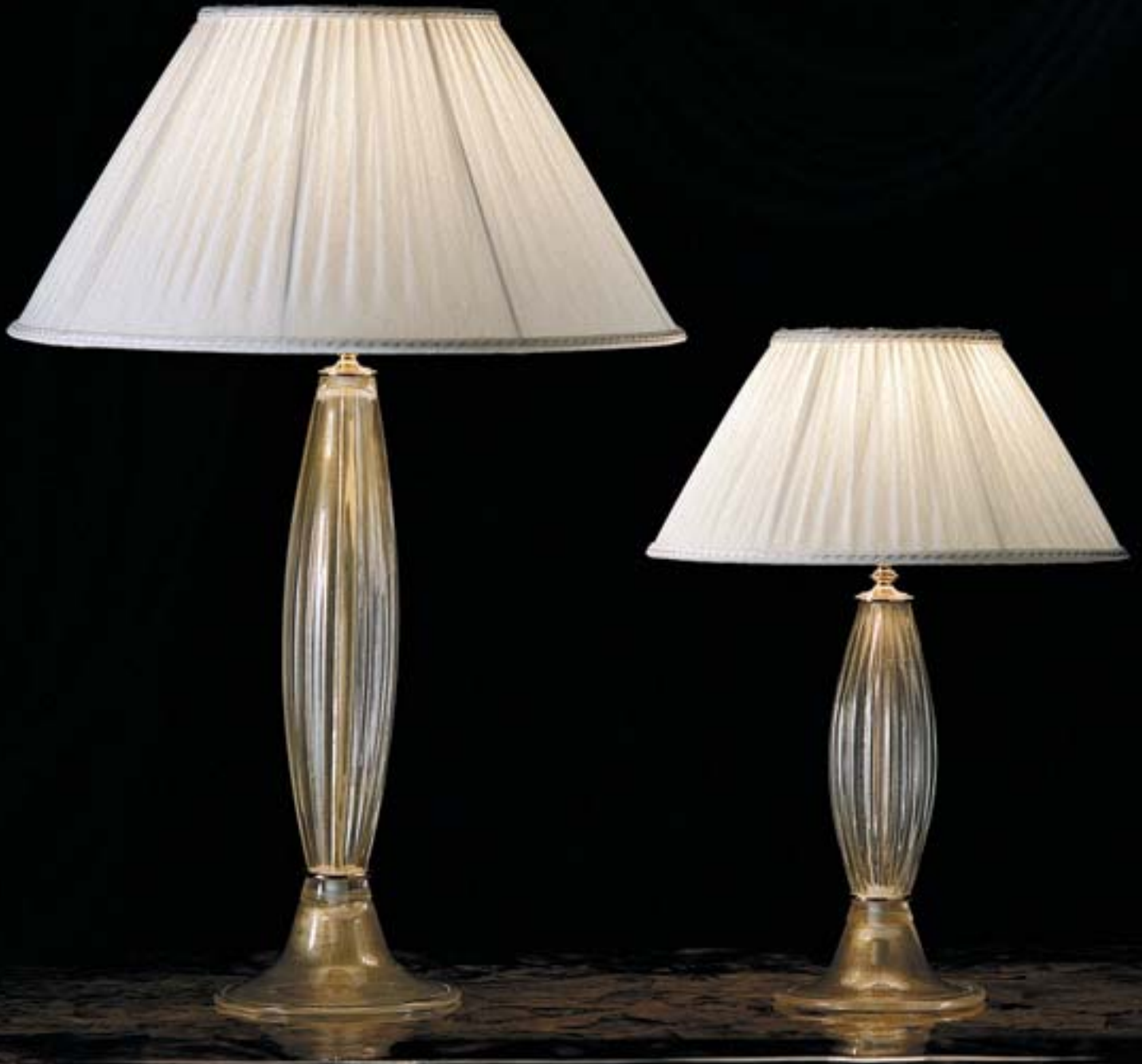
6302 - D48 H65 • 6301 - D33 H45