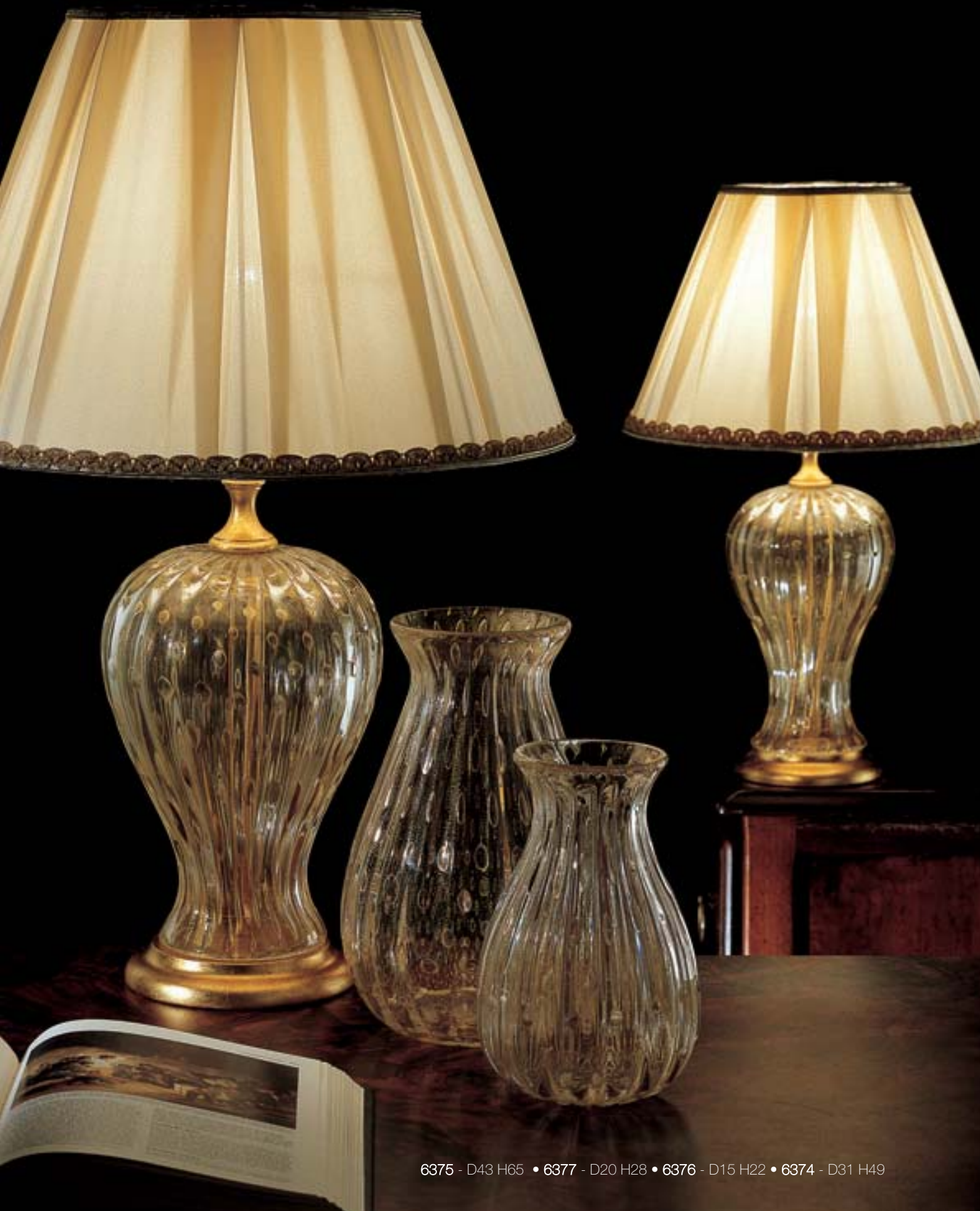
6375 - D43 H65 • 6377 - D20 H28 • 6376 - D15 H22 • 6374 - D31 H49